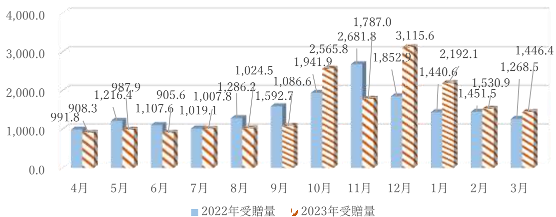
2022年度～2023年度 月別受贈量の比較

※2023年度（2023年4月～2024年3月）の食料品寄贈は、 706件、18,558kg となりました。寄付をしていただいた企業・団体様、そしてサポーター（個人）のみな様に心より感謝申し上げます。みな様の善意が多くの方々の支援へと繋がりました。